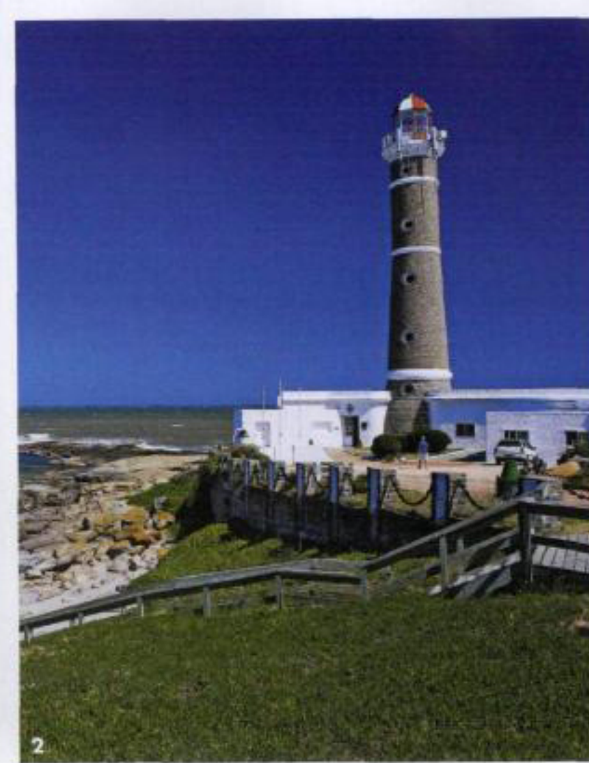
1. A piscina e o deque do Playa Vik, na vila de pescadores convertida em hot spot José Ignacio. 2. Farol de José Ignacio. 3. O porto de Punta del Este.